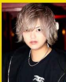
人事担当 タコホイ