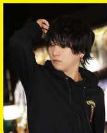
リーダー おみたろす