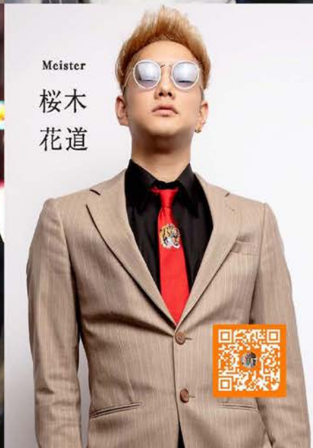
Meister 桜木 花道