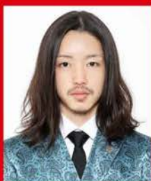
マネージャー アイル