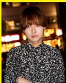
リーダー はるな はる