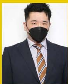
フロアチーフ グリ